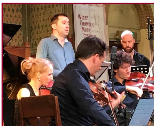
Grande Finale 2019

Het bestaansrecht van het WCMF heeft zich in de loop van de jaren bewezen. Daarom is het streven het festival de komende jaren te laten voortbestaan. Daarbij zetten we in op een behoedzame groei, zowel qua inhoud als qua omvang. Vanwege de wens om het festival te blijven verbinden aan de in Weesp qua ambiance en akoestiek niet te evenaren Van Houtenkerk, waar maximaal 225 bezoekers in kunnen, zal de groei vooral gezocht worden in extra concerten. Op verzoek van een aantal vaste passe-partout gasten, wordt het festival echter niet in aantal dagen verlengd. Wel zijn er mogelijkheden voor extra concerten met een informeler karakter buiten het festival om. Bovendien heeft de stichting, na een succesvolle pilot in juni 2019, besloten om vanaf komend jaar ook door het jaar heen kamermuziekconcerten te organiseren. Met haar festival en de incidentele concerten draagt de Stichting Chamber Music Weesp bij aan de bekendheid en culturele aantrekkelijkheid van Weesp.