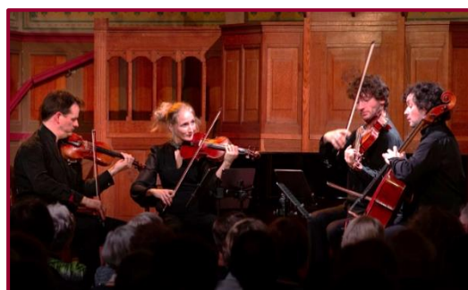
Navarra String Quartet